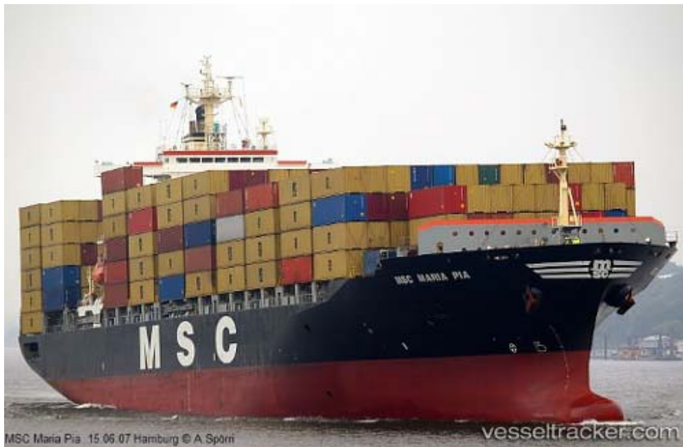
MSC Maria Pia - 15 06 07 Hamburg